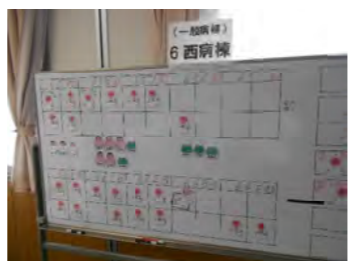
ホワイトボード上に 医師、看護師、傷病者等の 人形を配置しています

市立病院では去る6月8日(土)に災害時医療訓練の一環としてエマルゴ訓練を実施しました。エマルゴ訓練とはスウェーデンで研究開発された災害発生時に多数の傷病者を受け入れるための机上訓練ツールです。その方法は病院内のトリアージブース、診察室、手術室、病棟などをそれぞれトワイド上に想定し、傷病者役のマグネット人形を来院から入院まで必要な部署を移動させることで訓練が進行します。災害対策本部と各部署間の情報伝達はトランシーバーや院内PHSで行い、患者や病院スタッフの移動は災害対策本部が統制します。訓練中の時間は1分間が30秒に設定されており倍速で進行するため情報の収集・伝達に負荷がかかった状態となります。