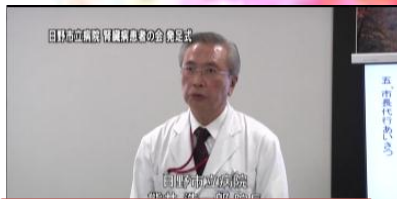
熊井病院長より開会のあいさつ