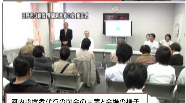
河内設置者代行の閉会の言葉と会場の様子