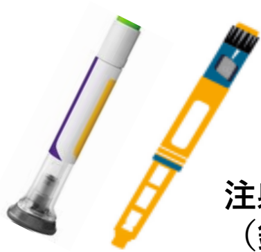
注射器本体 (針内蔵を含む)